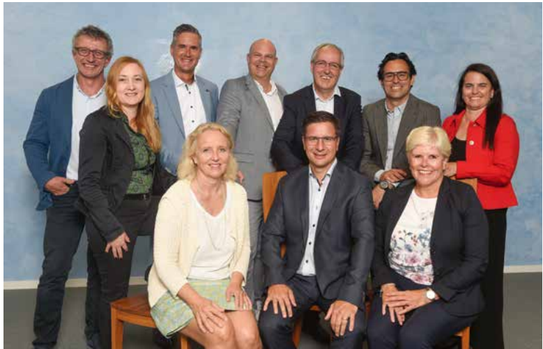
Der neue Gemeinderat.