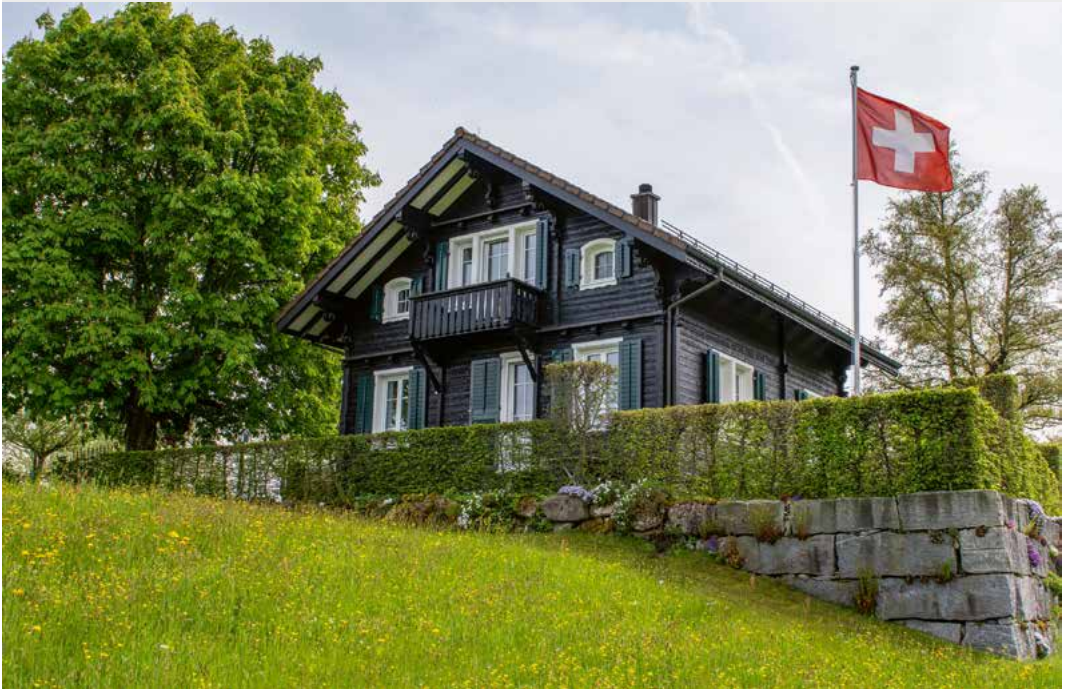
Chalet zur Manesse (erbaut 1947), Eschtürlistrasse 31, Horgenberg, 2023.