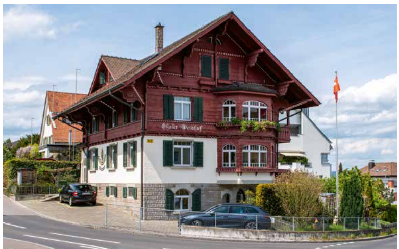
Chalet Weidhof (erbaut 1914), Heubachstrasse 63, 2023.