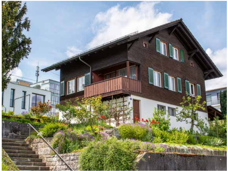
Plattenstrasse 33, 2023.

flächen im Innern pflegt Alice Tschopp seit jeher mit Schmierseife. «Darauf schwöre ich», meint sie.