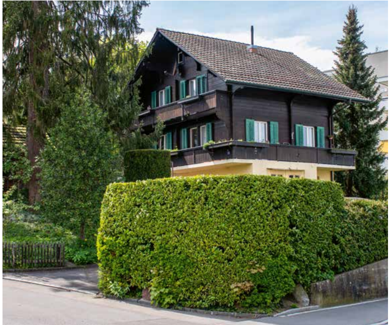
Steinbruchstrasse 58, 2023.