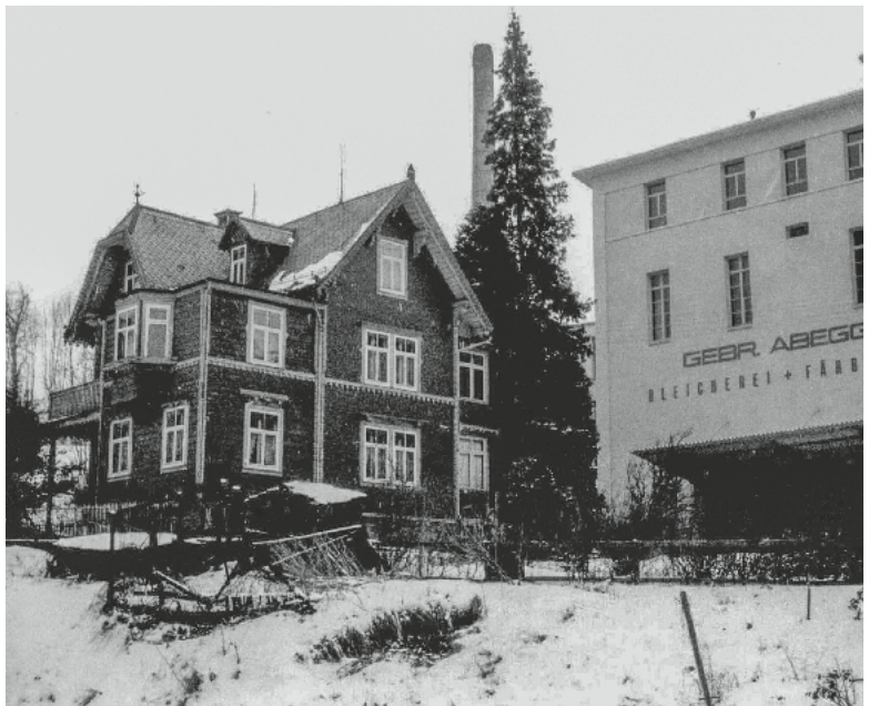
Ehemals Burghaldenstrasse 8 (1961 demontiert), um 1950.