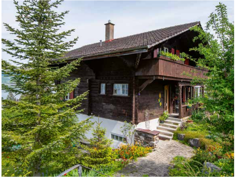
Institutweg 5, 2023.