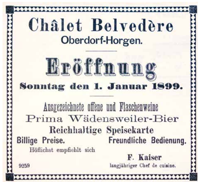
Inserat im «Anzeiger des Bezirks Horgen» zur Eröffnung des Chalets Belvédère im Oberdorf, 31.12.1898.