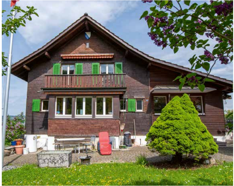
Rebhüslistrasse 17, 2023.

Strassenabschnitt noch Hernerholzgasse, und den von einem Arbeitsloseneinsatz erbauten Fussweg von der Rebhüslistrasse zur Strohwiessstrasse gab es noch nicht, er wurde erst 1984 geplant und gebaut.