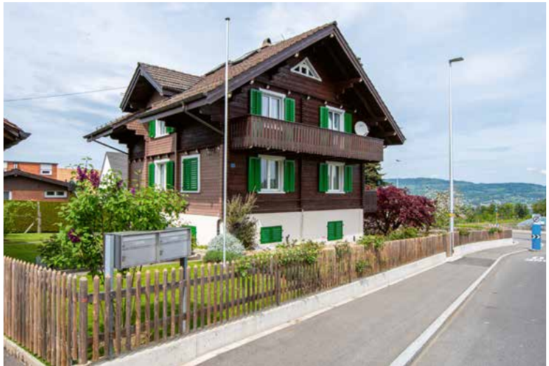
Hüttenstrasse 2, 2023.