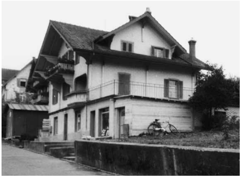
Ehemals Glärnischstrasse 68, Konsumverein Horgen (1964 abgebrochen), 1962.