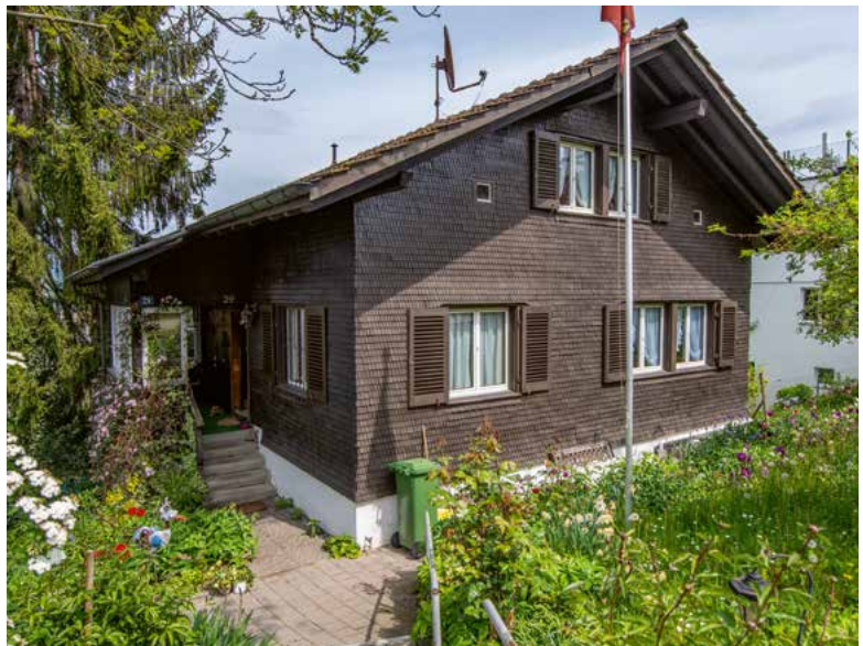
Bergstrasse 29, 2023.