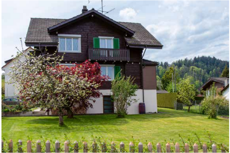
Hüttenstrasse 2, 2023.

des Hausherrn ist der einzige Nachteil für ein Chalet mit zwei Kachelöfen das Holzen. Dies sei neben der Gartenarbeit stets eine Herausforderung. Der grosse Vorteil, ein eigenes Chalet zu besitzen und darin zu wohnen, seien aber der Charme dieses Häuschens, keine direkten Nachbarn über und unter einem zu haben und natürlich die beiden Kachelöfen.