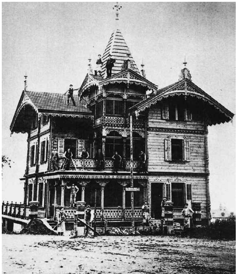
Bau Chalet Belvédère, Oberdorfstrasse 51, 1898.