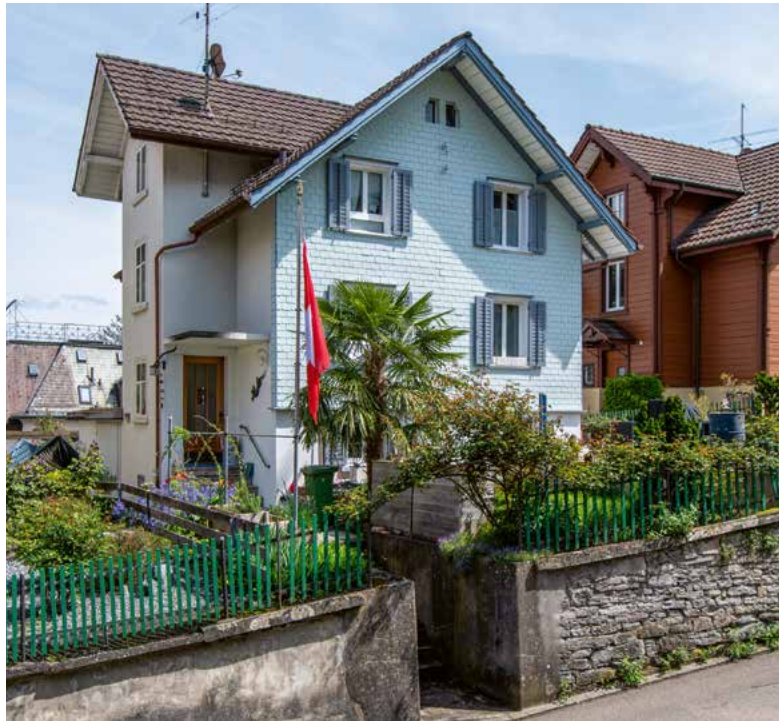
Zugerroseweg 7. Rechts im Bild: Chalet am Zugerroseweg 5, 2023.