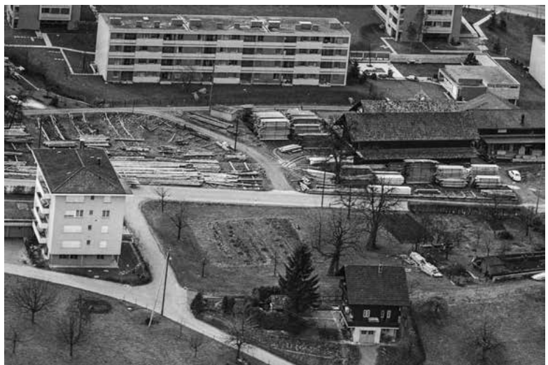
Steinbruchstrasse 58, 1966.

Die Bewohnerinnen, die inzwischen leider verstorbene Elsi Sigrist und Thea de Groot, empfangen mich herzlich und erzählen mir von der Geschichte des prächtigen Holzbaus. Heute steht das Chalet inmitten von Wohnblöcken an der Ecke Steinbruch-/Sennhüttenstrasse. Zwei Stockwerke hoch, gepflegt neben der grossen Tanne im Garten. Ein paar Stufen führen zum Eingang, der sich bergseits des Hauses befindet.