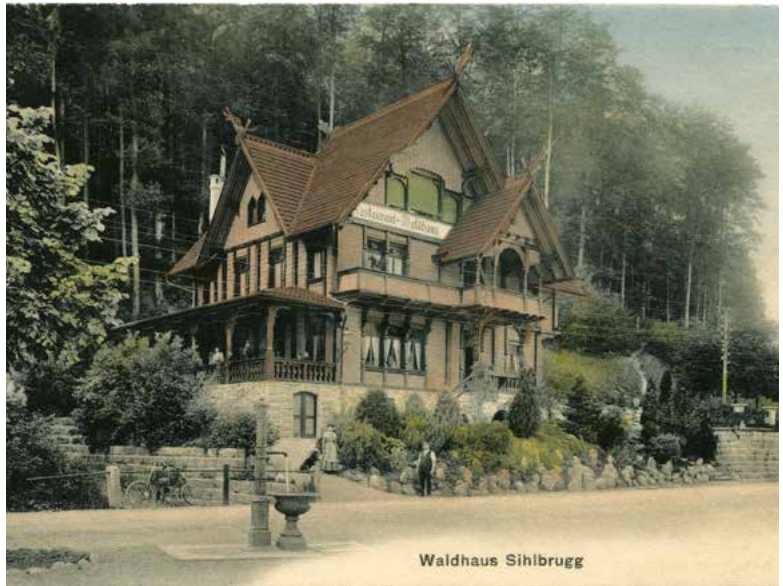
Waldhaus Sihlbrugg (erbaut 1898), um 1920.