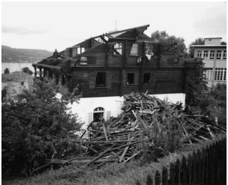
Ehemals Kamblisteig 2 (abgebrochen), 2001.