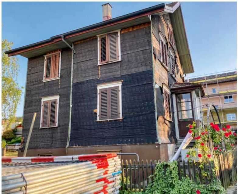
Ehemals Katzenstrasse 3 (2023 abgebrochen), 2023.