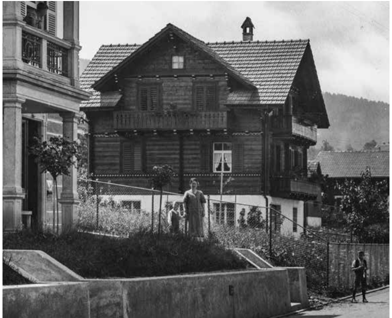
Ehemals Glärnischstrasse 26 (2012 abgebrochen), 1927.