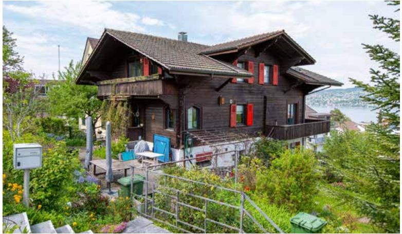
Chalet Vrenelis Gärtli (erbaut 1929), Institutweg 3, 2023.