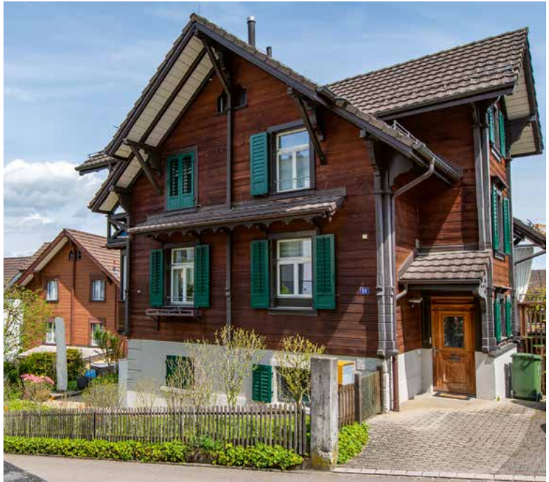
Chalet (erbaut 1899), Steinbruchstrasse 19. Links im Bild: Chalet am Zugerroseweg 5, 2003.

innerhalb von Industrieansiedlungen. Man versuchte vielmehr, die Arbeiter in bestehende Siedlungsstrukturen zu integrieren. In der Schweiz bestanden zwischen Bauern, Bürgern, Handwerkern, Industriellen und Arbeitern keine ausgeprägten Fronten. Die verschiedenen sozialen Schichten galten in erster Linie als «Eidgenossen».