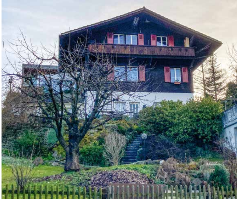
Chalet (erbaut 1929), Institutweg 5, 2023.

wurde das System Kienast: Die Innenwände sind gemauert, dann folgen zur Isolation eine Schicht Schlacke und Schilfmatten. Erst die Aussenfasaden vermitteln in der Kantholz-Bauweise das charakteristische Bild eines Chalets.