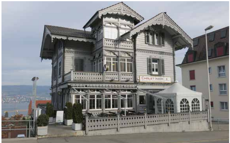
Chalet India (ehemals Belvédère), Oberdorfstrasse 51, 2018.

Untersuchungen in Cham (ZG) für die Periode 1920–1940 zeigen, dass Fabrikchalets oft für einfache Beamte und Fabrikarbeiter errichtet worden sind. Dort, wo als Erstbesitzer Zimmerleute oder Baumeister ausgewiesen sind, wechselten die Bauten innerhalb der folgenden zwei Jahre in die Hand von Fabrikarbeitern oder Angestellten. In Horgen mit ebenfalls zahlreichen Fabriken erstaunt es deshalb nicht, ebenfalls diesen kostengünstigen Haustyp zu finden. Die konstruktive und gestalterische Vielfalt der errichteten Chalets lässt auf verschiedene Chaletfabriken als Lieferanten schliessen. Leider gibt das Bauarchiv Horgen keine Auskunft über Bauten, die vor 1970 errichtet wurden. Pläne bei privaten Hauseigentümern und das im Staatsarchiv Sarnen aufbewahrte Firmenarchiv belegen, dass die Chaletfabrik Rikart in Belp, die Chaletfabrik Alexander Winckler aus Fribourg und die Holzbau AG Lungern entsprechende Bauten nach Horgen lieferten. Sicher haben Horgner auch Chalets weiterer Unternehmen errichten lassen. Aber ob dies Firmen wie Kuoni aus Chur, Lenzlinger aus Uster, die Chaletfabrik Ilanz oder Murer aus Beckenried waren, bleibt vorderhand ungeklärt.