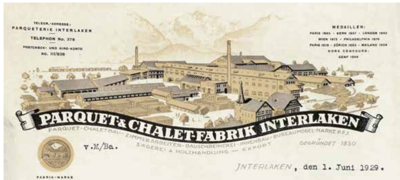
Briefkopf Parquet & Chalet-Fabrik Interlaken, 1929.

bleibt bislang offen. In der Gemeinde Horgen stehen beziehungsweise standen noch zahlreiche kleinere, durchaus bescheidenere Chalets: wenigstens 17 davon lieferte die Holzbau AG in Lungern. Bedrängt durch moderne Baustoffe sowie das flache Dach gründete das Holzbaugewerbe 1931 die Vereinigung Lignum. Ihre überaus rege Werbetätigkeit löste einen eigentlichen Holzbau-Boom aus. Dabei interessierten sich die Architekten vor allem für die Vorfabrikation und die Industrialisierung von Bauabläufen. Konservativ-handwerkliche Kreise dagegen orientierten sich am alten Chalet oder Bauernhaus, in dem sie das naturverbundene Idealhaus für das «Hirtenvolk» der Schweiz sahen. Immerhin, einer der Vorteile eines Fabrikchalets war – neben einem «Rundumpaketangebot» zu moderatem Preis – auch die Möglichkeit des späteren Ausbaus, nach Massgabe der Familiengrösse oder der finanziellen Möglichkeiten.