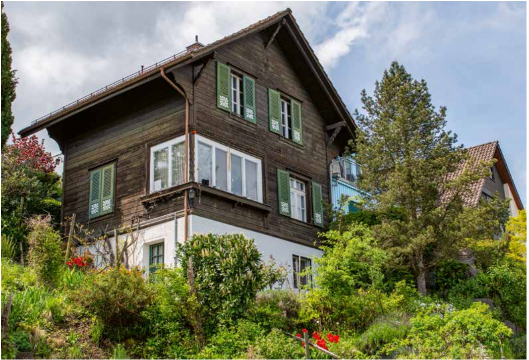
Chalet (erbaut 1930), Ebnetstrasse 53, 2023.