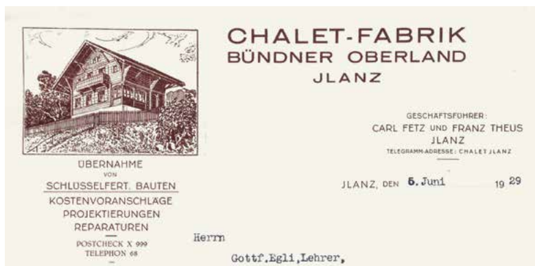
Briefkopf Chalet-Fabrik Bündner Oberland, Ilanz 1929.

Im Trend der Zeit entwickelten sich aus dörflichen Zimmereien und Schreinereien Chaletfabriken etwa Murer in Beckenried, Gasser in Lungern, Hüsler in Unterägeri, die Chaletfabriken Kuoni in Chur und jene in Ilanz.