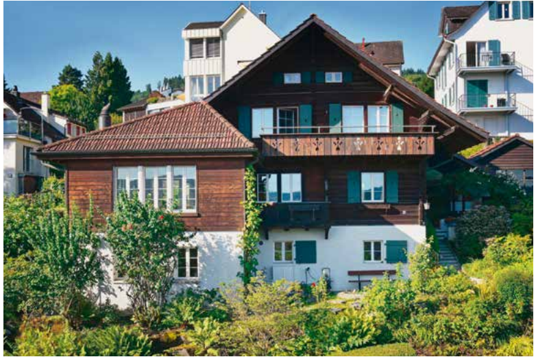
Kamblisteig 3, 2017.