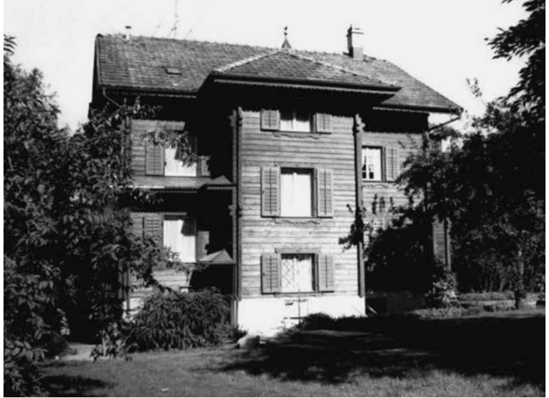
Ehemals Spätzstrasse 9 (abgebrochen), 1974.