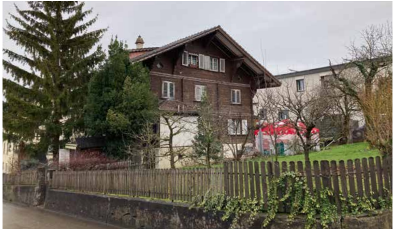
Chalet (erbaut 1925), Gehrenstrasse 11, 2023.

löste einen eigentlichen Holzbau-Boom aus. Dabei interessierten sich die Architekten vor allem für die Vorfabrikation und die Industrialisierung von Bauabläufen. Konservativ-handwerkliche Kreise dagegen orientierten sich am alten Chalet oder Bauernhaus, in dem sie «das naturverbundene Idealhaus für das Hirtenvolk der Schweiz» sahen, schreibt Dieter Schnell.