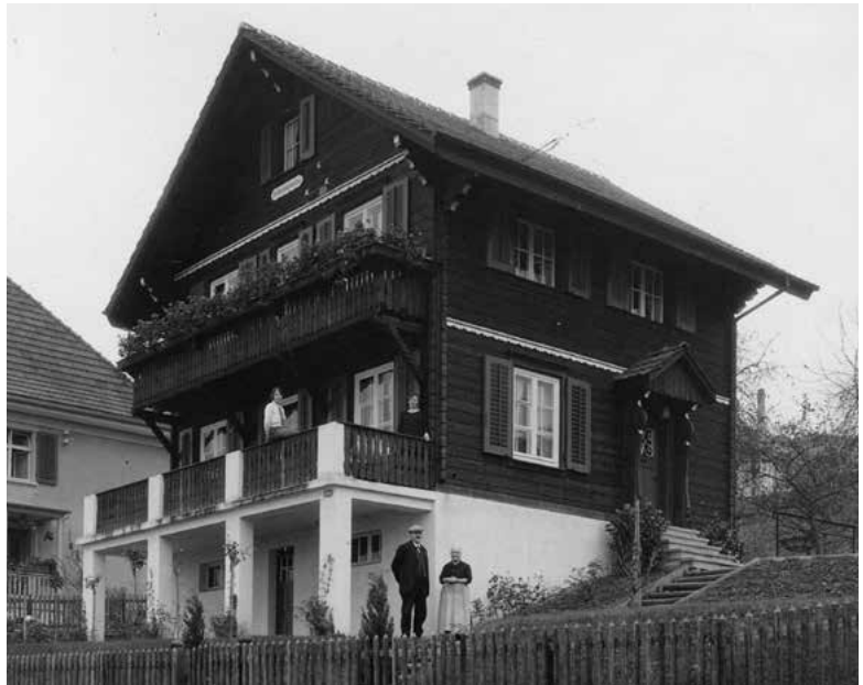
Brunnenwiesliweg 11, um 1927.

dreistöckige Haus verfügt über zwei Kellerräume und eine Waschküche im untersten Stockwerk, über eine Toilette, zwei Zimmer, verbunden mit einer Schiebetüre, und der Küche im ersten Geschoss sowie über drei Zimmer und einem Badezimmer im zweiten Geschoss. Seeseitig ist das Chalet mit einer Terrasse und einem Balkon versehen. Noch heute ist die Grundstruktur der ursprünglichen Räume ersichtlich, auch wenn die Innenräume den jetzigen Wohnbedürfnissen angepasst wurden und die Küche zum Wohnraum hin geöffnet wurde.